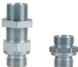
Schottadapter / Einschraubstutzen Bulkhead adapter / male stud coupling Seite / page 139 - 141